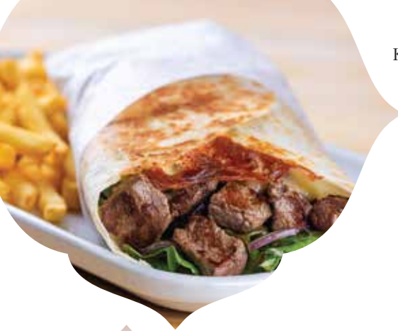
KEBAB DE MIGNON