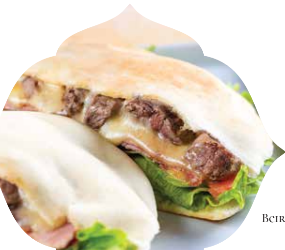
BEIRUTE DE MIGNON

Pão sírio Zattar, recheado com ricota temperada e mussarela derretida.