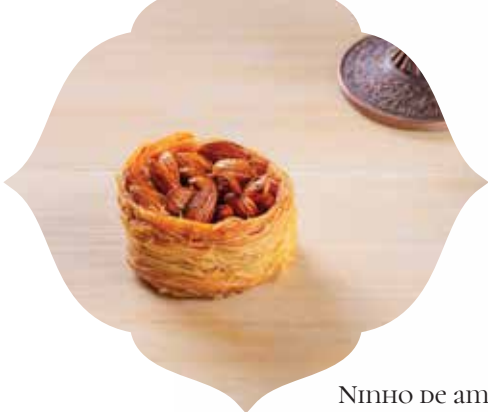
Ninho de amêndoa