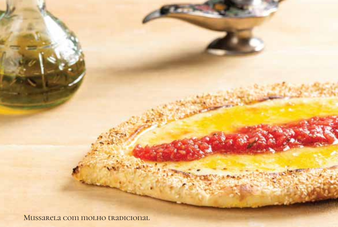
MUSSARELA COM MOLHO TRADICIONAL